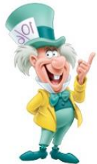
Il Cappellaio Matto

4. Rappresentano in modo ripetitivo una serie di situazioni (ricchi e poveri, paura del mistero...) e una serie di contenuti (allontanamento, matrigna, streghe...)