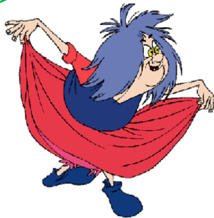
La Maga Magò