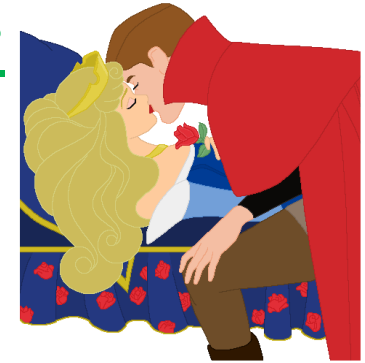
La bella addormentata

Iniziano quasi sempre con l'espressione: "C'era una volta"