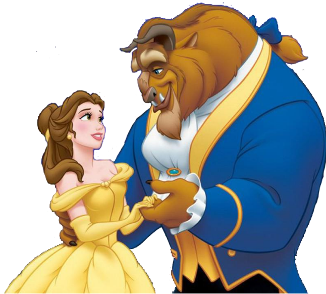
La Bella e la Bestia

Iniziano quasi sempre con l'espressione: "C'era una volta"