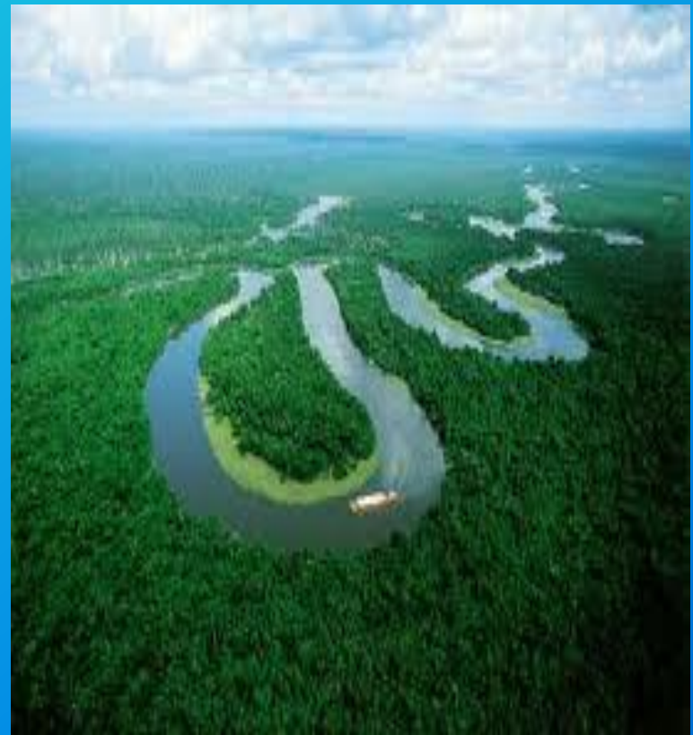
Rio delle Amazzoni.