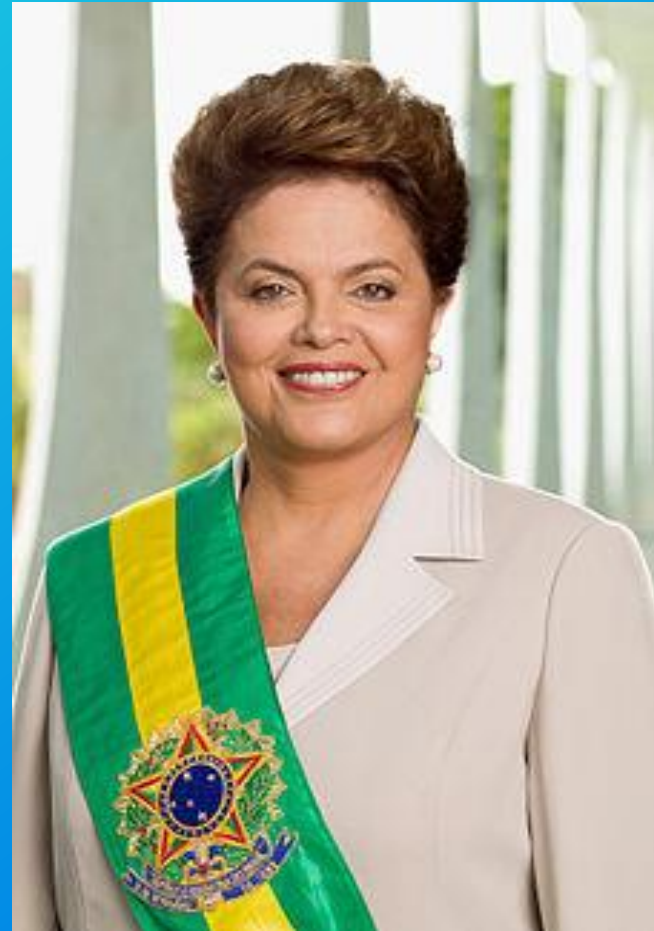
Dilma Rouseff, la presidentessa del Brasile.