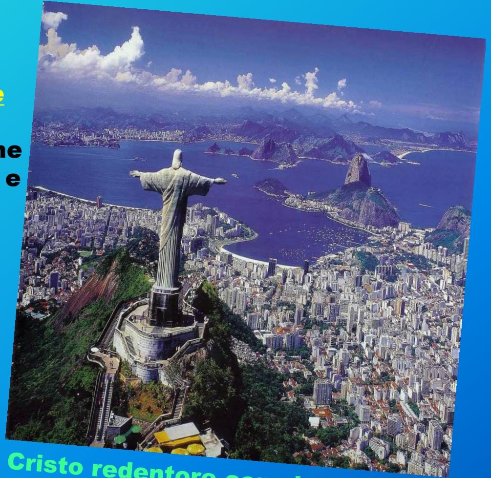
Cristo redentore con vista su Rio.