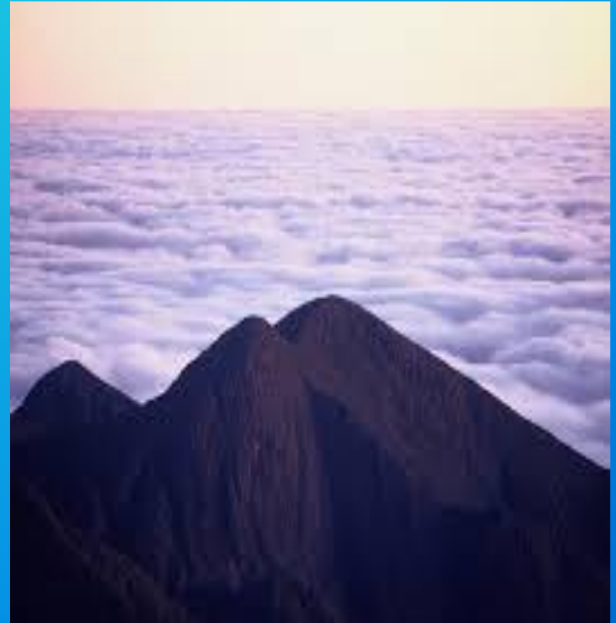
Pico da Bandeira.