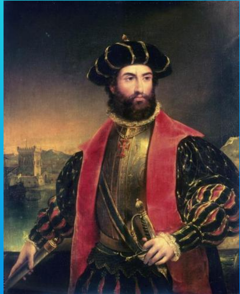
Pedro Alvares Cabral, l' uomo che scoprì il Brasile.

Il Brasile fu scoperto ufficialmente il 22 aprile del 1500 dal portoghese Pedro Alvares Cabral che arrivò sulle coste di Bahia, il Brasile era stato già in precedenza raggiunto da Vespucci , che ne era rimasto affascinato e si riferì a queste terre come ad un Nuovo Mondo .