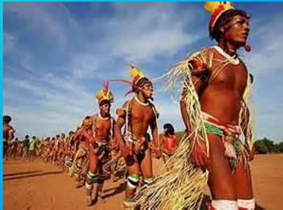
Popolazione indigena durante un rito religioso.