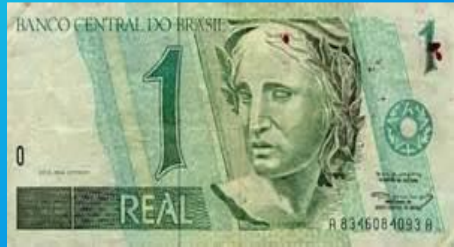
Banconota del valore di un Real Brasiliano.