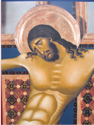
Il Cristo di Cimabue

MAESTA = Madonne raffigurate come imperatrici