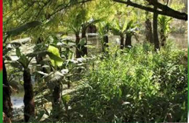
Isalo National Park

Nella parte occidentale è presente la savana e nella parte centrale c'è la prateria.