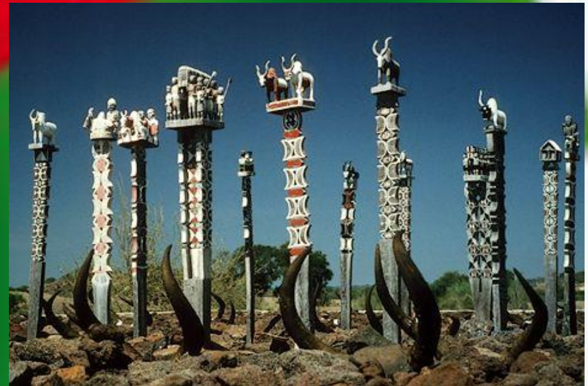
Conquista dei francesi