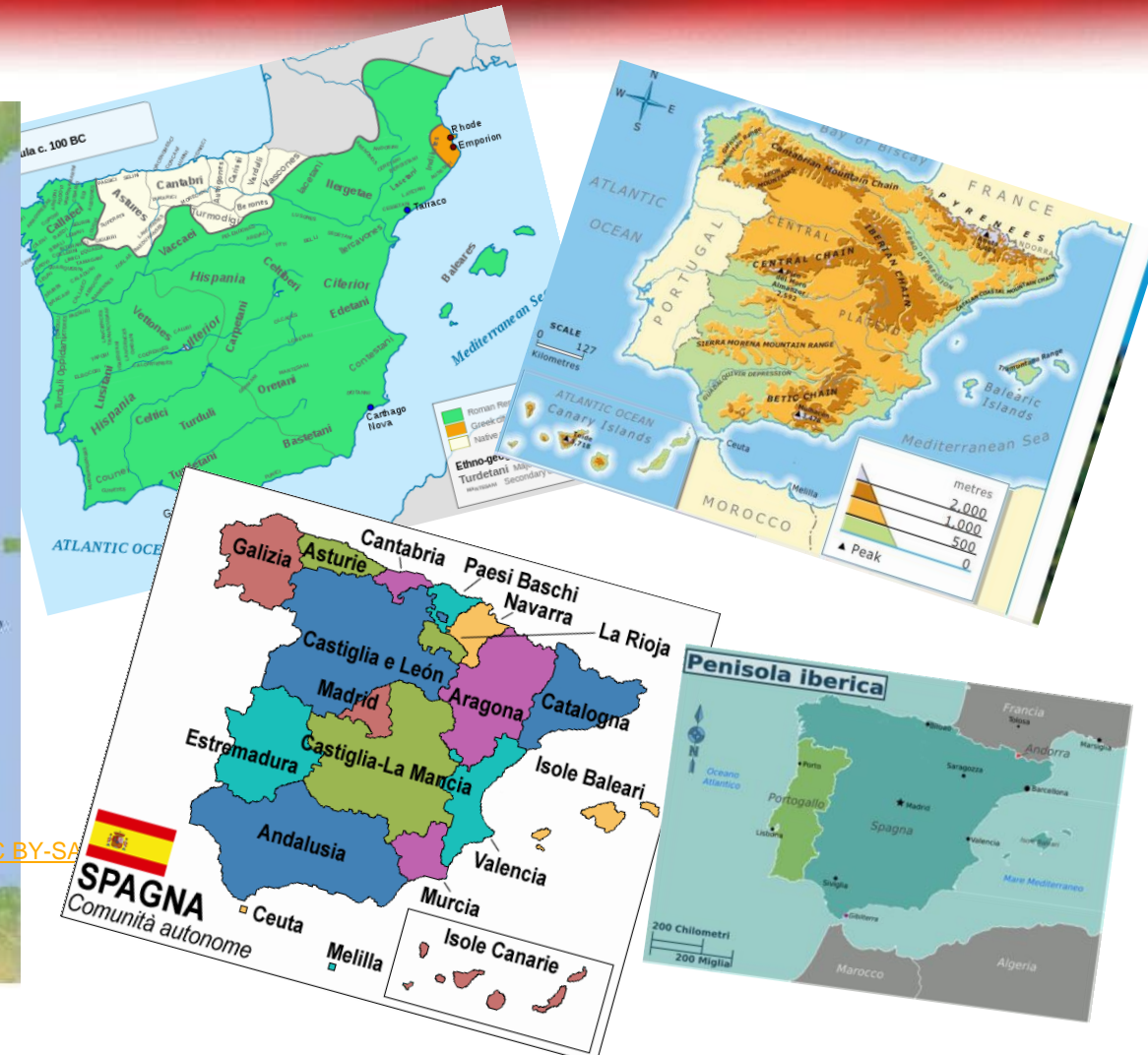
Physical map of Spain, equirectangular cylindrical projection